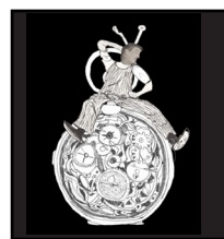
- Uhr Charlot 1 und 2 -

Die Vorträge werden auf Deutsch, Französisch oder Englisch gehalten. Die Teilnehmer können die gedruckte Übersetzung in den anderen Sprachen lesen. Diskussionen in kleinen Gruppen (ein- oder zweisprachig) werden als wesentliches und vertrauliches Element betrachtet.